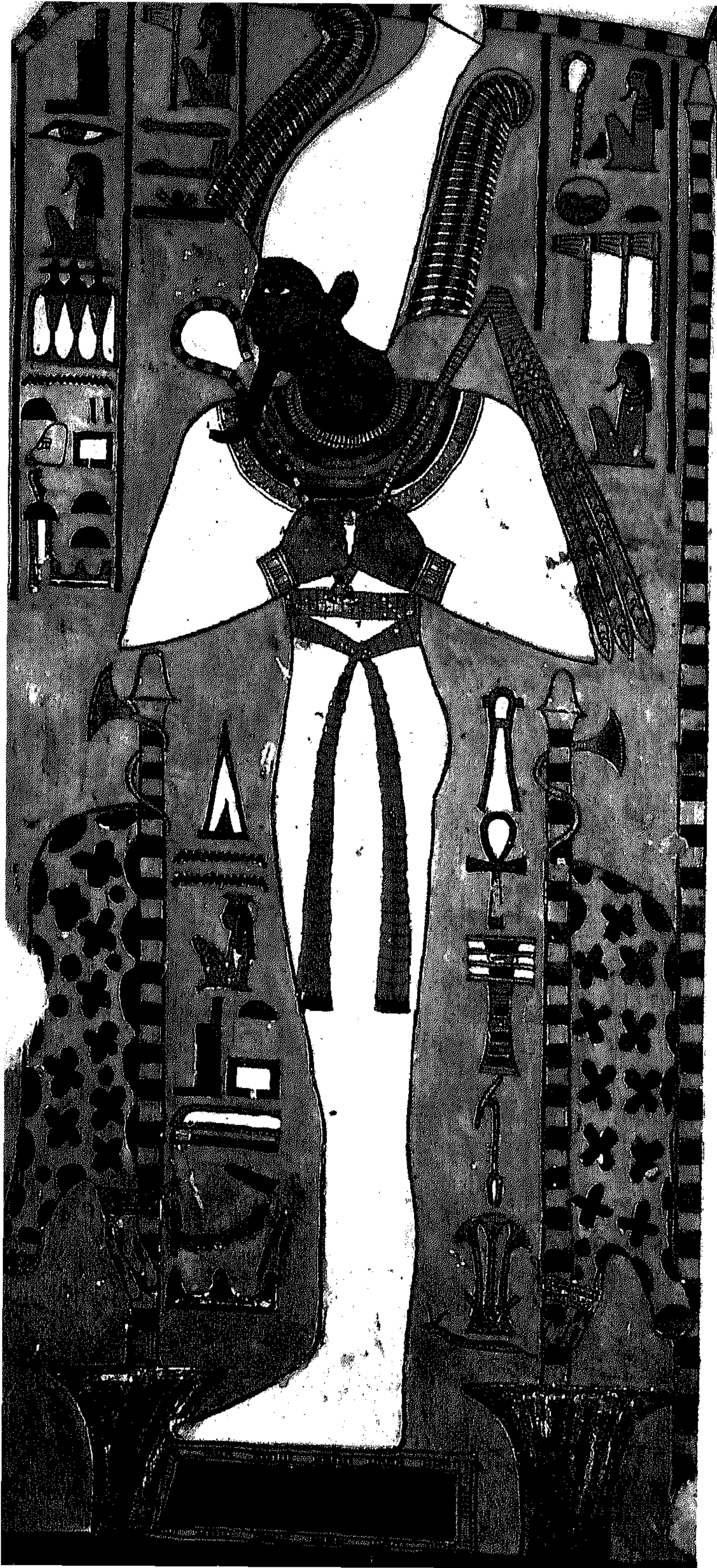
الإله أوزيريس من مقبرة نفرتارى - وادى الملكات - الأقصر الأسرة التاسعة عشرة - الدولة الحديثة